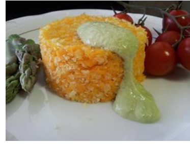
ingredientes= calabaza y repollo crudos, salsa ( cilantro, macadamias, limón, cebolla caramelizada, sal marina, agua.), espárragos.