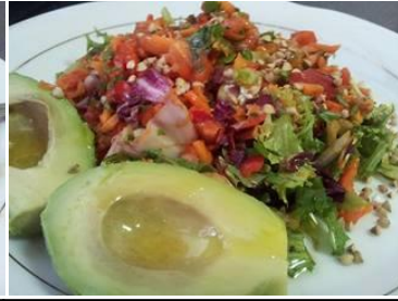
ingredientes= escarola, hojas verdes variadas, pimiento, zanahoria, aguacate, sarraceno activado, aceite de oliva, limón, sal marina.