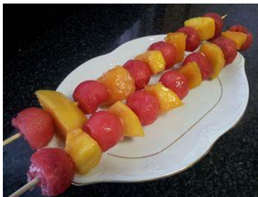
ingredientes= mango y sandia.

VIDEORECETA DE TARTA RAW DE CREMA DE CACAO CON AVELLANAS TIPO "NOCILLA O NUTELLA". El vídeo tiene 2 años y medio y me hace mucha gracia verme y oirme, jajaja!! que tiempos!! http://youtu.be/nhRLLgLJUls