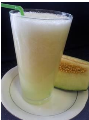
ingredientes= melón, agua. Todo bien batido.

LOS ESPARRAGOS LIMPIAN LOS RIÑONES. Aqui os dejo un artículo de la revista Discovery Salud. http://www.dsalud.com/index.php?pagina=articulo&c=150