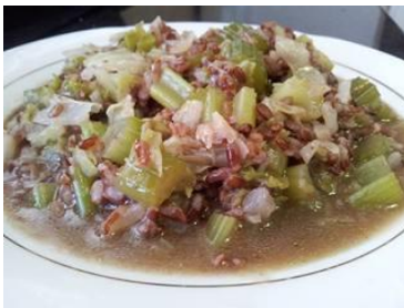
ingredientes= arroz rojo salvaje cocido 40 minutos, apio, repollo, cebolla, ajo, poco aceite de oliva, sal marina.