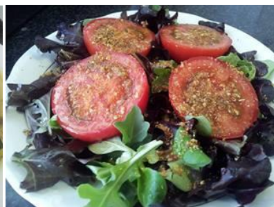
ingredientes= tomates, hoja verde variada, salsa de semillas ( sésamo, lino, girasol, calabaza, goji, aceite de oliva, sal marina)