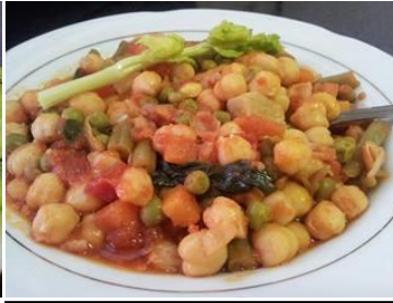
ingredientes= garbanzos cocidos, apio, judías verdes, zanahorias, guisantes, tomate, cebolla, ajo, poco aceite de oliva, sal marina, pimentón.