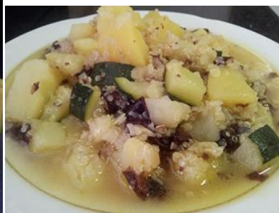
ingredientes= quinoa cocida 20', patatas, calabacín, alga dulce, cebolla, ajo, poco aceite de oliva, sal marina.