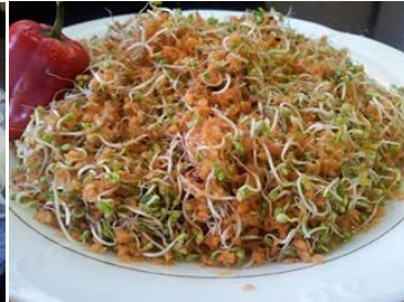
ingredientes= germinados de brócoli, zanahoria rallada, aceite de oliva, limón, sal marina.