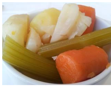
ingredientes= patata, zanahoria, apio, repollo, aceite de oliva, sal marina