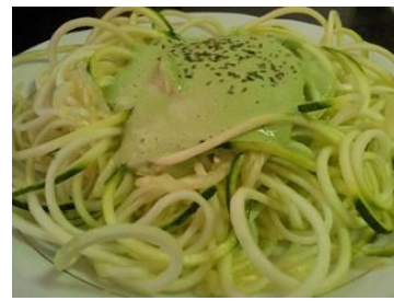
ingredientes= calabacín espiralizado, salsa ( cilantro, macadamias, cebolla caramelizada, limón, sal marina, agua, todo bien batido hasta que emulsione.)