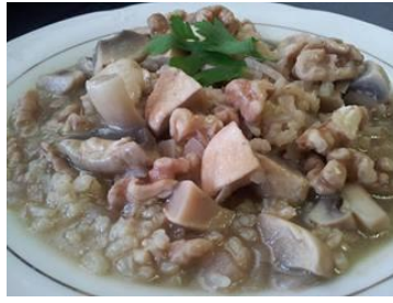
ingredientes= arroz integral cocido 20 minutos, nueces, champiñones, cebolla, ajo, poco aceite de oliva, sal marina, cominos.