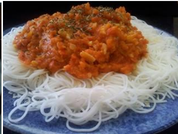
ingredientes= espaguetis de arroz cocidos, salsa boloñesa de almendras (tomates, pimiento rojo, cebolla, aceite de oliva, sal marina, pimentón), albahaca, orégano.