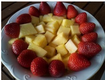
ingredientes= fresas y piña.

Aquí te dejo un vídeo divulgativo muy sencillito sobre el tema. http://youtu.be/ae7iSKBVWxQ